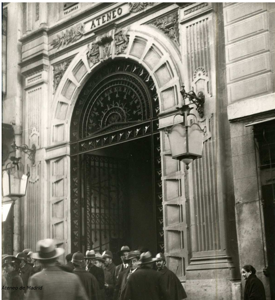
Ateneo de Madrid

La inauguración, que estaba prevista para el pasado 14 de mayo, fecha que celebra la fundación de esta entidad, tuvo que ser pospuesta por la pandemia. «A pesar de la compleja situación sanitaria que estamos viviendo, los ateneístas han puesto toda su ilusión en celebrar el Bicentenario de esta docta casa», ha comunicado el Ateneo de Madrid.